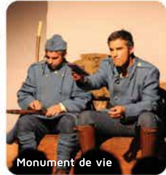
Monument de vie