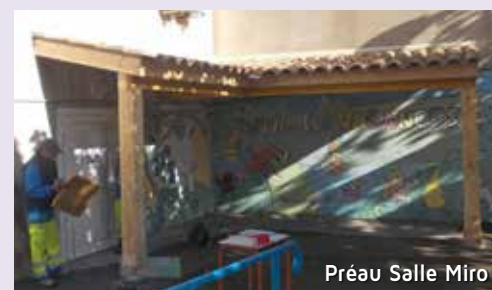
Préau Salle Miro