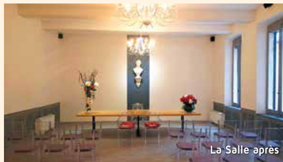
La Salle après