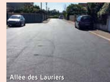
Allée des Lauriers