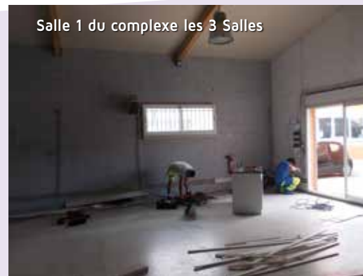
Salle 1 du complexe les 3 Salles