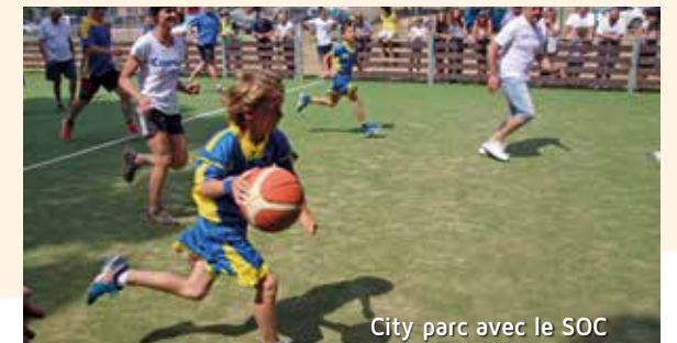
City parc avec le SOC