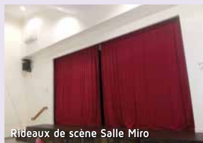
Rideaux de scène Salle Miro