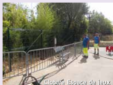
Cloture Espace de jeux