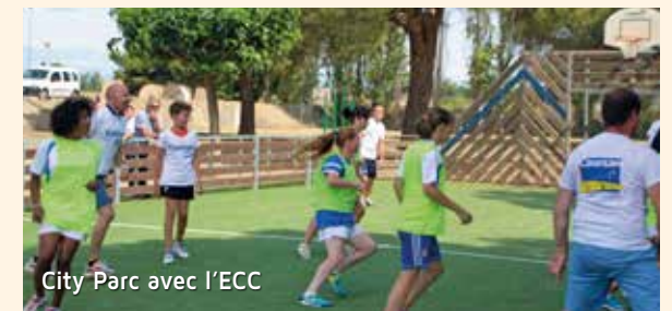
City Parc avec l'ECC