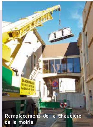
Remplacement de la chaudière de la mairie

Au-delà de ces projets, le personnel assume la maintenance et l'entretien du patrimoine, des espaces verts, des équipements et des voiries de la Commune. Merci pour leur compétence et leur disponibilité.