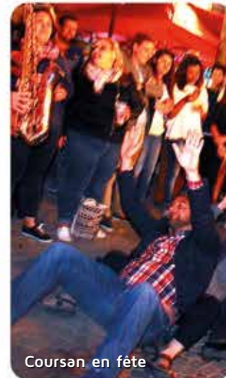
Coursan en fête