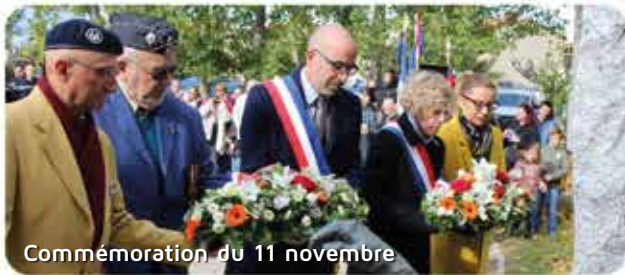
Commémoration du 11 novembre