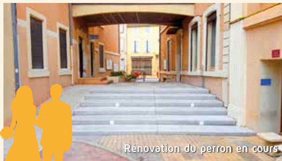
Rénovation du perron en cours