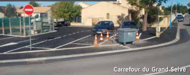
Carrefour du Grand Selve