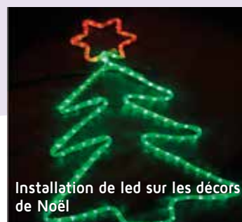
Installation de led sur les décors de Noël