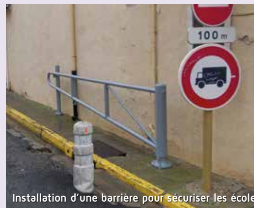
Installation d'une barrière pour sécuriser les écoles