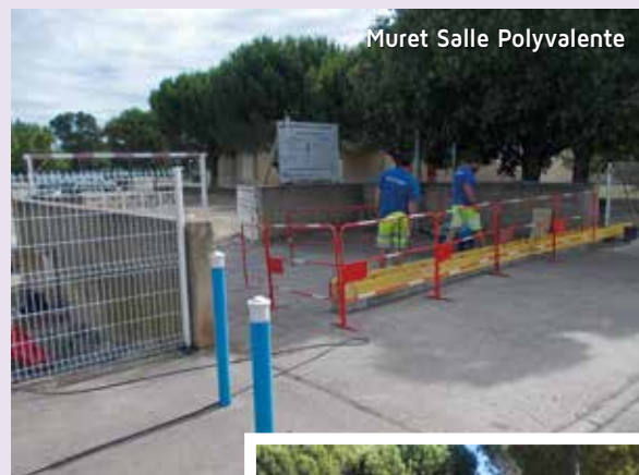
Muret Salle Polyvalente