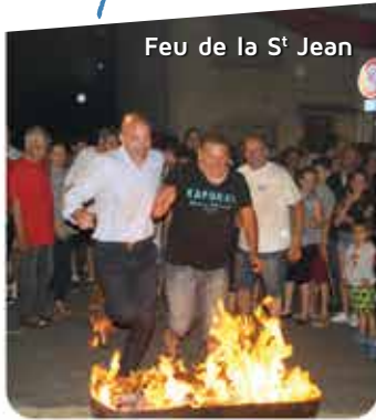
Feu de la St Jean