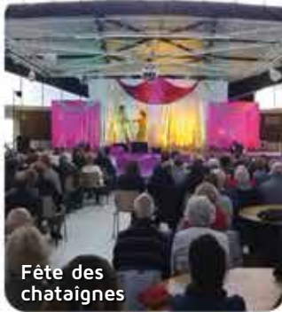
Fête des châtaignes