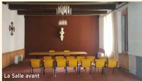
La Salle avant

C'est dans une salle des mariages refaite à neuf que dorénavant les Coursannaises et les Coursannais pourront s'unir. Adieu la moquette au mur et bienvenue dans une salle plus lumineuse et chaleureuse. Afin de compléter ces travaux, le perron est en cours de modification pour permettre un accès plus facile, plus sécurisé et plus agréable à cette salle.