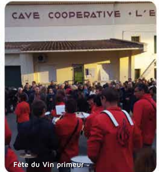
Fête du Vin primeur