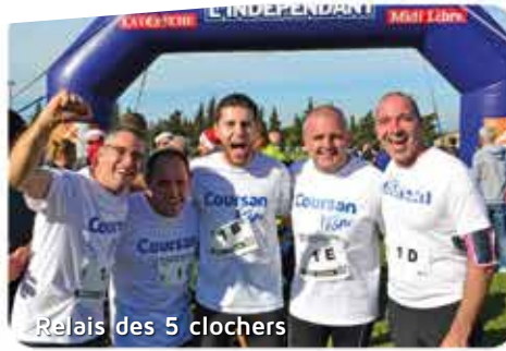
Relais des 5 clochers