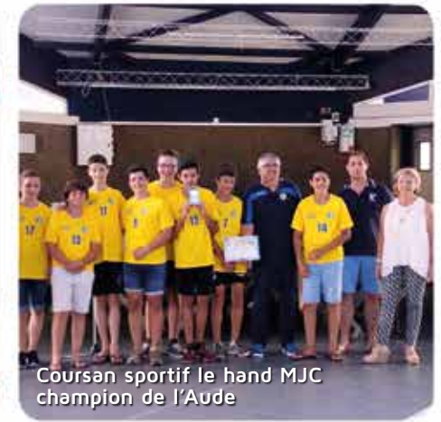
Coursan sportif le hand MJC champion de l'Aude