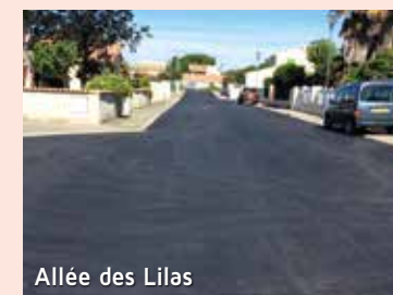
Allée des Lilas