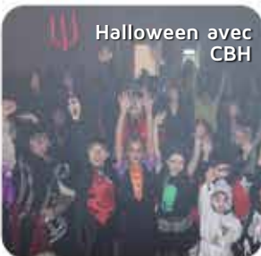
Halloween avec CBH