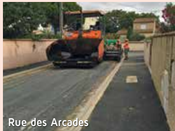
Rue des Arcades