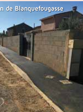
Rue de Blanquefougasse