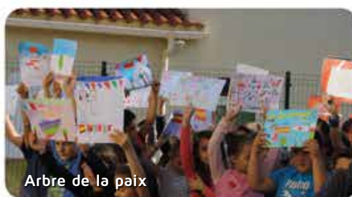
Arbre de la paix