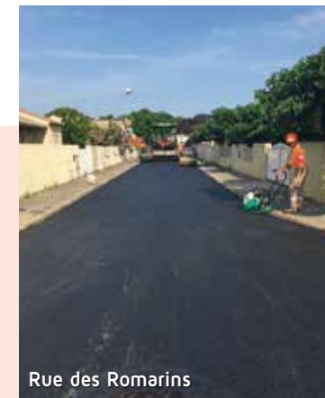
Rue des Romarins