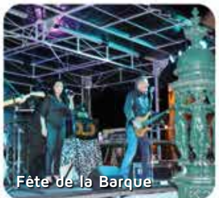
Fête de la Barque