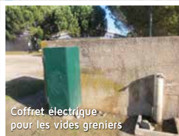
Coffret électrique pour les vides greniers