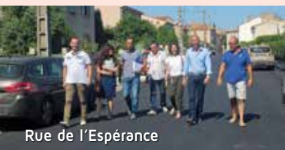
Rue de l'Espérance