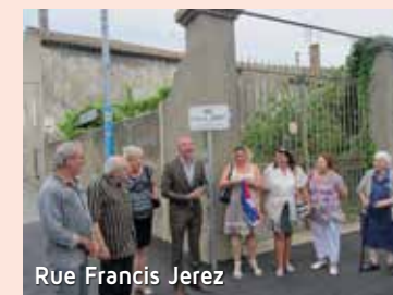
Rue Francis Jerez